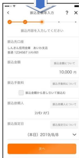
NEW [ 振込画面 ]