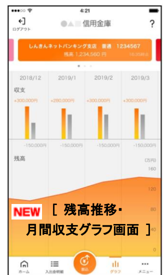
NEW [ 残高推移・月間収支グラフ画面 ]