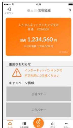
[ ホーム画面 ]