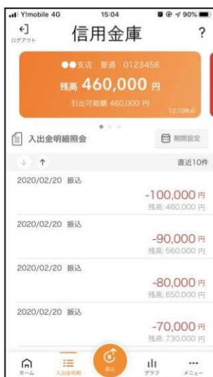
[ 入出金明細照会画面 ]